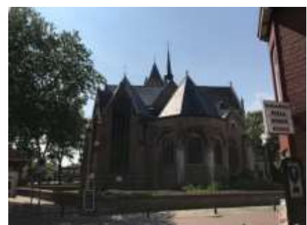
Festungsstadt Tholen um 1640 / Jachthafen von Tholen / Spätgotische Kirche