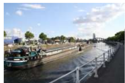
Ganz schön Verkehr auf dem Seekanal Brüssel-Schelde

Der Verlauf des Kanals in Brüssel änderte sich nach der Eröffnung des Kanals Charleroi-Brüssel im Jahr 1832. Durch die Verknüpfung der beiden Kanäle entstand eine direkte Verbindung zwischen dem Hafen von Antwerpen und der Industrie rund um Charleroi. Die 1896 gegründete Gesellschaft NV Zeekanaal en Watergebonden Grondbeheer Vlaanderen führte ab 1900 umfangreiche