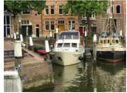
Anfahrt auf Dordrecht / Einfahrt in den Passantenhafen / Liegeplatz

Nach einem feinen Nachtessen aus der Bordkombüse machen wir noch einen längeren Abendspaziergang durch das schöne Dordrecht. In einer kleinen Bar gibt es sogar noch ein Bier.