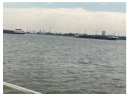
Durchfahrt Moerdijkbrücken / viel los im Dordtsche Kil

Um 16.00 Uhr erreichen wir Willemstad und können hier im alten Hafen festmachen. Im Anschluss erkunden wir das kleine, ehemalige Garnisonsstädtchen. Wunderschön einfach, erg leuk würde der Holländer sagen.