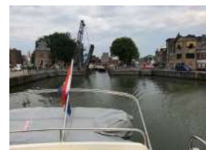
Jachtensluis Willebroek / Denkmal für die Schiffer / Jachtensluis Willebroek Oberwasser