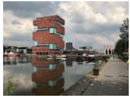
Das Stadthaus wird zurzeit komplett restauriert / Schelde Denkmal / Schiffahrtsmuseum