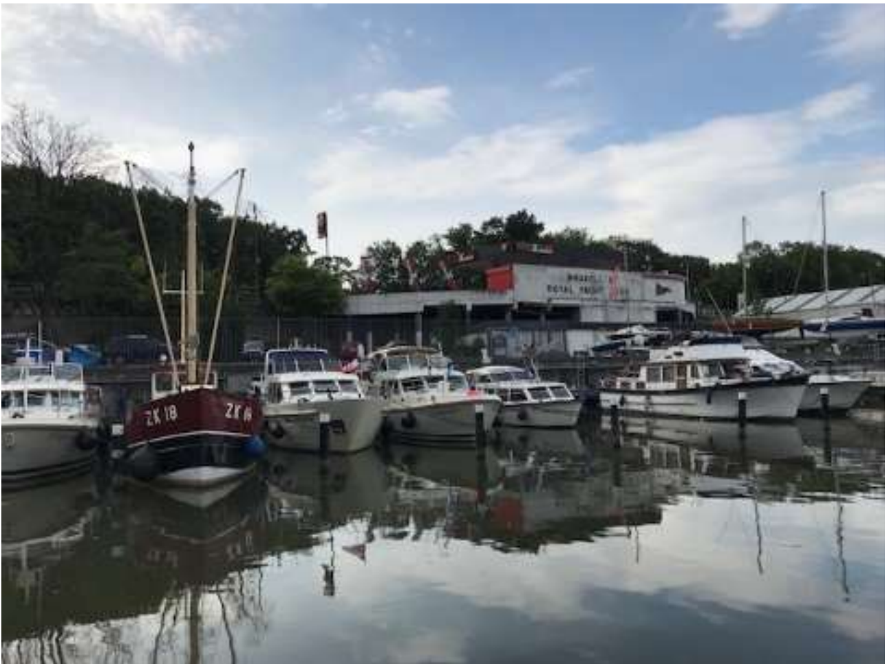
Liegeplatz der MY Zattera beim Bruxelles Royal Yacht Club, nur wo ist das Royale?