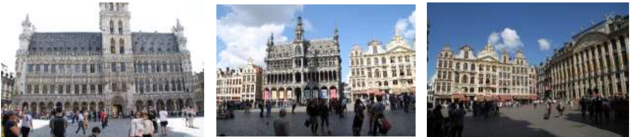
Grand-Place mit dem Rathaus ( https://de.wikipedia.org/wiki/Grand-Place/Grote Markt )

Impressionen aus Brüssel, Infos über Brüssel → https://de.wikipedia.org/wiki/Brüssel