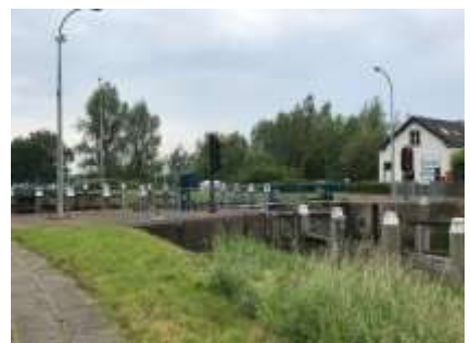
Schifffahrtsmuseum Dordrecht / Biesbosch / Ottersluis