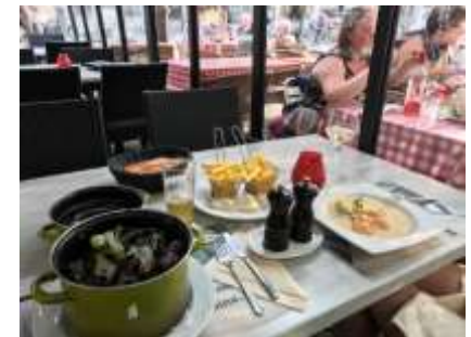
Hauptbahnhof / neuer Anker für unser Schiff? / en Guete