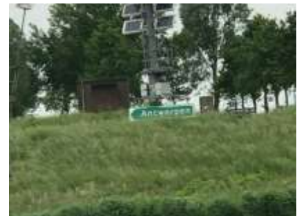
Auf dem Weg nach Antwerpen / Containerschiff 135 m x 17.10 m, 6789 Tonnen / Wegweiser, wir können uns nicht verfahr

In Tholen laufen wir den Hafen an, um hier die Nacht zu verbringen. Wir werden von einer lustigen Hafenmeisterin empfangen und machen nach dem Festmachen einen kleinen Stadtbummel. Tholen ist wie Willemstad eine ehemalige Festungsstadt. Neben den kleinen Gässchen gibt es auch eine spätgotische Kirche und einem Stadthaus aus dem 14. Jahrhundert zu bestaunen. Auf dem Rückweg zum Schiff gibt es eine feine Glace, das gehört doch auch zu einem Stadtbummel dazu.