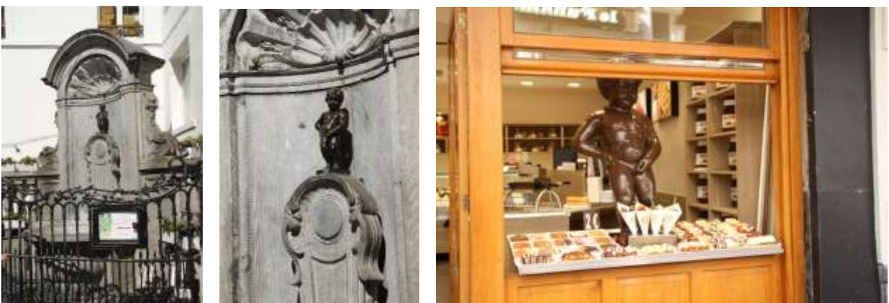
Manneken Pis und natürlich einmal aus Schokolade! (mehr dazu → https://de.wikipedia.org/wiki/Manneken Pis )