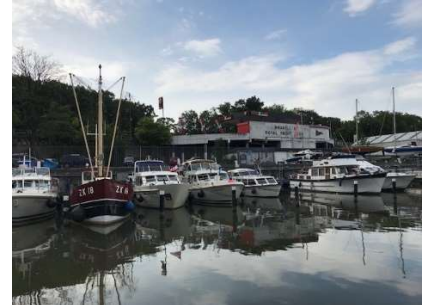
Schleuse Zemst / viel Brücken auf dem Weg nach Brüssel / BRJC Brüssel (im Hafenbecken schwimmt sehr viel Unrat herum!)