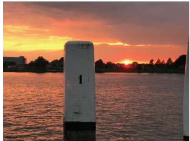
Sonnenuntergang in Dordrecht