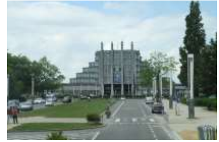
Nationalbasilika des Heiligen Herzens / Atomium, Weltausstellung 1958 / Der „Grand Palais“, Weltausstellung 1935