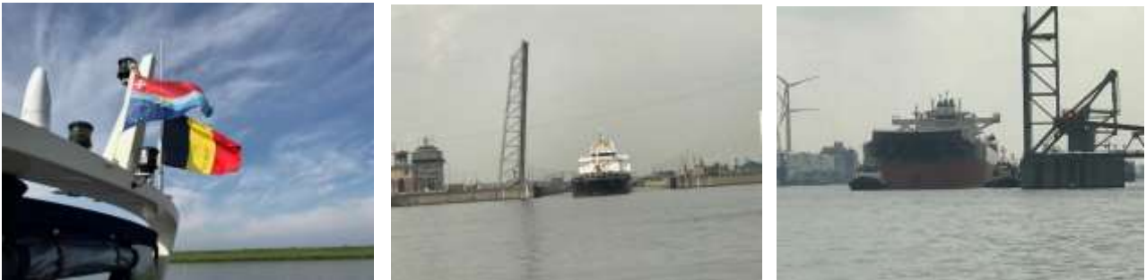
Im Geräteträger führen wir nun die Belgische Flagge als Gastflagge / Berendrechtsluis / Begegnung mit einer Seeboot

Bevor wir den Hafen von Antwerpen erreichen, setzen wir die Belgische Flagge. Schlagartig wird es nun wieder hektischer! Wir passieren die Zandvliet- und Berendrechtsschleuse aus der gerade eine Seeboot fährt und können zusehen wie eine sehr grosse Seeboot mit 4 Schleppern durch die Lillobrücke fährt resp. bugsiert wird. Dazwischen unzählige Tanker und Frachter die von einem Dok ins andere Dok fahren, um zu laden oder zu löschen oder bereits wieder leer oder geladen den Hafen verlassen. Der Vergleich mit einem Ameisenhaufen ist nicht ganz von der Hand zu weisen.