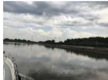
Royerssluis / auf der Schelde bei Ebbe / Zufahrt zur Jachtensluis Willebroek

Schleuse fahren setzt gerade die Flut ein und wir werden mit 16 Km/h zur Jachtensluis Willebroek hochgespült. Leider nützt das nicht sehr viel, weil bei Wasser Tiefststand nicht in die Jachtschleuse eingefahren werden kann, wir dümpeln somit fast eine Stunde vor der Schleuse. Hier hätte ich besser im PC Navigo den optimalen Weg gewählt und den Weg durch die Schleuse der Grossschifffahrt genommen, wir wären eine Stunde früher in Brüssel gewesen. Die kleine Jachtschleuse wird mächtig vollgepackt und man sieht doch gewisse Unterschied bei den einfahrenden Jachtbesitzern! Auch hier dauert es etwas länger bis wir schlussendlich weiterfahren können, aber nimm dir Zeit und nicht das Leben! Nach Brüssel gibt es sehr viele Brücken, Durchfahrtshöhe meistens etwas über 4 Meter. Alle anderen gehen meistens nach einer freundlichen Anfrage sofort auf. Vor Brüssel melde ich mich