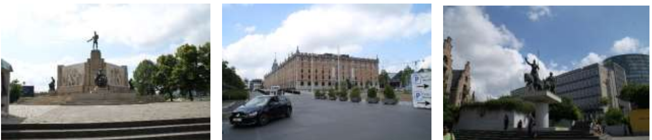
Denkmal für die Arbeit / ein neues Brüssel entsteht / Denkmal Don Quichote