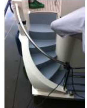
.... und gearbeitet habe ich auch noch ein wenig, Treppen und Badeplattform sind neu gestrichen!