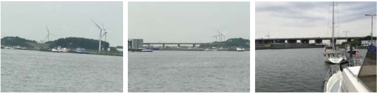
Vokeraksluise für die Grossschifffahrt und die Jachtsluis

Nach dem Durchschleusen fahren wir nun mit viel Rückenwind in Richtung Antwerpen. Der Schelde-Rhein-Kanal ist 35 Kilometer lang, verläuft von Antwerpen zum Volkerak und ist ein Teil der Schelde-Rheinverbindung. Diese verbindet Antwerpen mit allen Flüssen im Rhein-Maas-Delta. Die Gesamtlänge beträgt rund 50 Kilometer.