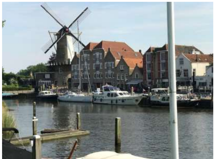
Die Kanonen sind immer noch auf die Hafeneinfahrt gerichtet / Willemstad kleines Garnisonsstädten