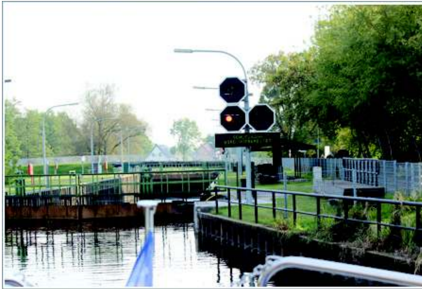
PUUR-Yachtcharter Sommer 2015

Das Revier, welches zwischen Ostsee im Norden, der Oder im Osten, der Elbe im Westen, der unteren Havel im Südwesten und dem Spree-Oder-Kanal im Südosten liegt ist wohl eines der größten Wassersportreviere Europas.