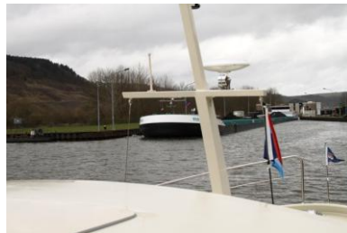
Bergfahrender Schubverband unter Schweich / Mehring / ausfahrender Schubverband in der Schleuse Detzem