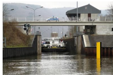
Begegnung mit einem taifahrenden Schubverband / alles geht gut! / Schleuse Detzem

Nach fast 3 Stunden "volles Rohr" gegen die Strömung, immer schön dem Motorschiff „SLACK“ folgend, erreichen wir die Schleuse Detzem! Ein Frachtschiff und fünf Linssen Yachten haben locker Platz! Wie wir bereits über Funk erfahren haben, gibt es hier auf der „SLACK“ Schichtwechsel, respektive fliegender Wechsel der Kapitäne. Während des Schleusenvorganges wird mit dem bordeigenen Kran das Auto des in den Urlaub gehenden Kapitäns an Land gestellt und das Auto des neuen Kapitäns aufgeladen - alles während des Schleusens - Tor auf und der Neue fährt weiter, so geht das heute bei der christlichen Binnenschifffahrt oder man könnte auch sagen: Zeit ist Geld, wir sind beeindruckt!