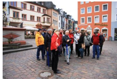
Porta Nigra / Basilika Konstantin / Stadtführung