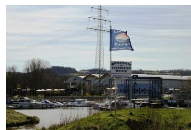
Schleusenverein in Formation kurz vor Merzig / Jachthafen Merzig

Bis auf das Wetter hat alles perfekt geklappt. Petrus wird sich gedacht haben, wenn ein Berner schönes Wetter für Donnerstag bestellt, reicht es wenn ich Samstag liefere!!