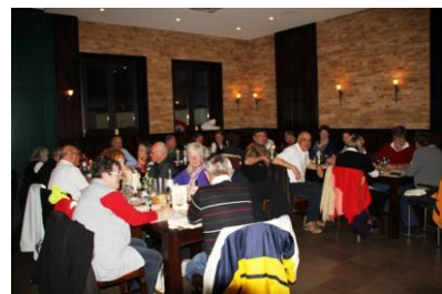
Hochhaus im Mittelalter / Hauptmarkt Trier / Dom und Liebfrauenkirche / Kapitänsdiner

Im Restaurant Convinum, unter der Leitung der Trägergesellschaft des Bistums Trier, geniessen wir das leckere Kapitänsdiner mit Zwiebel-Riesling-Rahmsuppe, Kalbssteak, Zuckerschoten, Fingermöhrrchen und Butternudeln. Das abschliessende Schokoladenküchlein ist eine zusätzliche Mahlzeit und wir fahren wohlgenährt mit dem Taxi zum Hafen zurück, wo der Wirt im alten Fährturn angesichts des drohenden Umsatzes gleich das Lokal schliesst und uns einen Schlumi verwehrt.