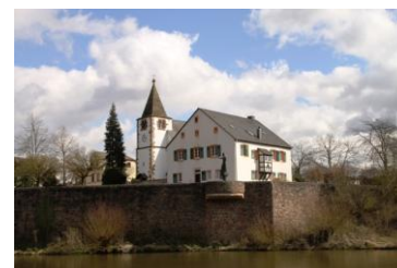
Schleuse Kanzem / Ausfahrt Unterwasser / Konz

Die Einfahrt in die Mosel ist nicht spektakulär und doch ist es für viele von uns das erste Mal, dass wir einen so namhaften Fluss befahren. Die Dimensionen zusammen mit der Strömung und dem Wind