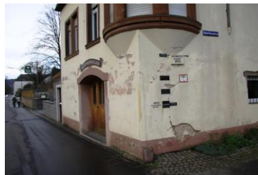
Yachthafen Neumagen-Drohn / Berncastel / Hochwassermarken in Neumagen

Der restliche Nachmittag steht allen Teilnehmern unseres Törns zur individuellen Verfügung. Manche machen einen Abstecher nach Berncastel, einem der schönsten Moselstädtchen, andere machen bei einem Winzer eine Degustation und wieder andere geniessen das Nichtstun an Bord unserer schönen Linssen Yachten. Das Nachtessen nehmen wir im nahe gelegenen „Hafenbeizli“ zu uns.