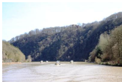
Saarburg / Landschaft und Burgen