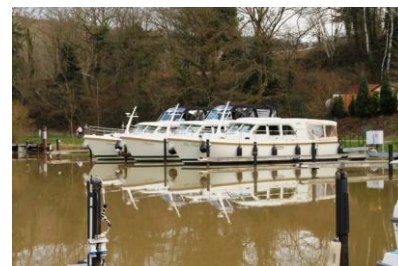
Grau Reiher / Yachthafen Beurig / Festgemacht nach einem langen intensiven Tag

Um 18.30 Uhr erreichen wir glücklich aber doch etwas müde den uns schon bekannten Clubhafen Beurig/Saarburg. Wir machen eine kleine Besichtigungstour ins hübsche Städtchen Saarburg. Wir genießen einen gemütlichen Abend an Bord unserer MY Orca.