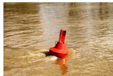
Schichtwechsel auf der MS SLACK / ehemaliges Schiff der SRN AG, Basel / Backbordtonne in der Strömung

Wie üblich werden wir während des Schleusens wieder einmal geduscht. Brutale Wassermassen stürzen über das Wehr nebenan. Im Verlaufe des Nachmittages, zuvor haben wir Trier mit seinen vielen