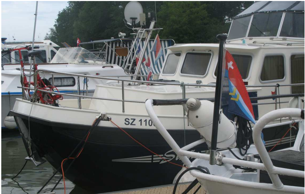
2 Schiffe mit Schleusenvereinswimpel