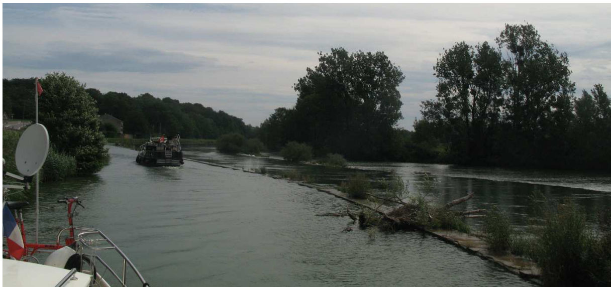
Am Doubs entlang